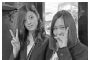
受け担当の30回生学年幹事

引き続き行なわれた懇親会では、豪華景品を当てるビンゴゲーム、昔と今の広高を写真で見ると、こげ茶色の旧制服と紺色の現制服の比較展示など、楽しい企画で盛り上がりしました。ビンゴゲームは大変好評で、景品は同窓生からの提供も含めて10品以上。特賞のディズニーペア招待券は30回生が当り、デジカメのCanonIXYは2回生に当たりました。本年28年度の総会懇親会も内容盛りだくさんで開催します。是非、足をお運びください。