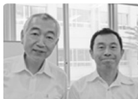
2014/9/20(土) 会場:宮城広瀬高校多目的ホール「清流館」