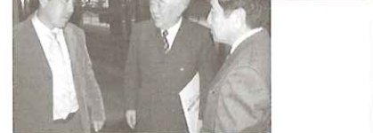
▲宗彦前会長と元広瀬高校教職員の豪華な顔ぶれ