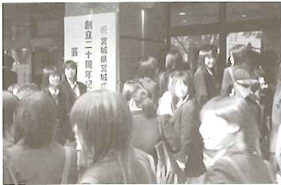
▲県民会館前に茶色い人ばかり(一部青!)