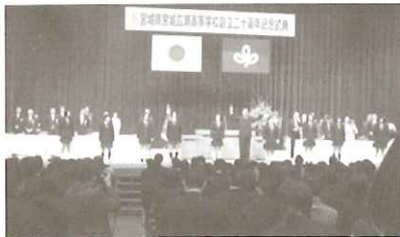
▲式典には歴代の先生方が一同に集結

伝統校には遠く及ばないけど比較的新参の広瀬もいつの間やら20歳。人間なら市民会館で暮れるようなお年頃、そろそろ新設校なんて言う人もなくなり、周りに荒地しかなかった落合駅周辺も、今や県立こども病院も出来て県内の注目スポットの仲間入り。そんな短いようで長