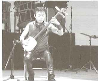
▲式典終了後芸術鑑賞会「白神コンサート」

晩秋というにはまだ穏やかな10月31日、会場の県民会館前には通行の邪魔になるほどの生徒に埋め尽くされ、怪しげな人が近づいてくるかと思えば教職員。それはそれはすごい活況。