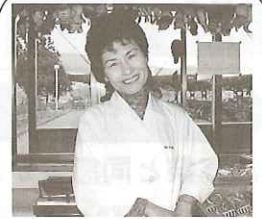
↑購買といえば! そう! この笑顔も健在です。 いつもお世話になってます。

まだあったのか!? コッペパンを2つに開き、そこにチョコを塗ったしろもの。今になって思うと超ヘビーなパン。チョコのパキパキとした歯ごたえをオジサンになった今、君は体験してみる自信はあるか? 興味はある。